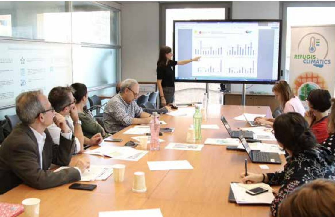
Visita de l'equip OASIS a Barcelona (octubre del 2019) Visita del equipo OASIS a Barcelona (octubre del 2019)

Els projectes OASIS i Refugis Climàtics han estat en contacte constant, intercanviant les seves experiències en el desenvolupament dels projectes, nodrint-se de les similituds i diferències.